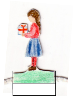
Mädchen (ohne Standfläche) ca. 2,5 cm